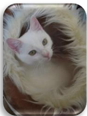
Isabela une minette sortie de la rue encore bébé