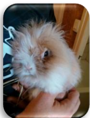
Copain un lapin nain abandonné, il était sur la défensive et désormais est devenu un amour de lapin